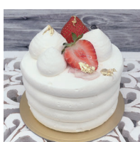
Simple white シンプルホワイト