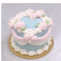
Pearl blue パールブルー