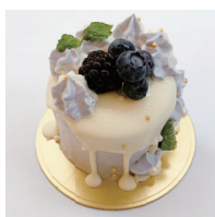
Violetberry ヴァイオレットベリー