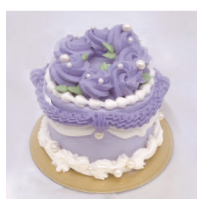
Pearl Lavender パールラベンダー