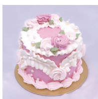
Pearl Madonna パールマドンナ