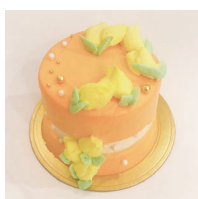
Caramelorange キャラメルオレンジ