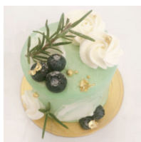
Elegantgreen エレガントグリーン