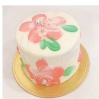
Paintflower ペイントフラワー