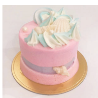
Mermaidshower マーメイドシャワー